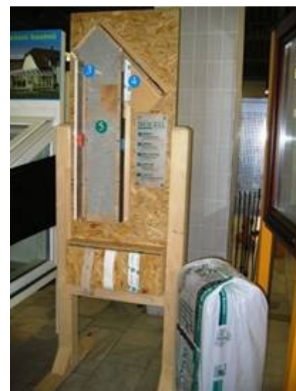
ISOCELL Vertriebs Ges.m.b.H.