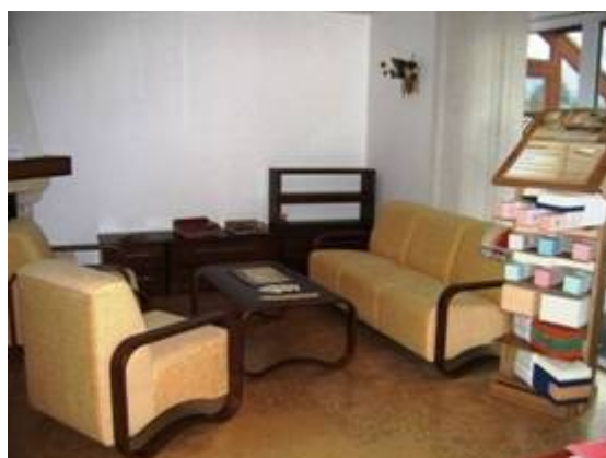
JELÍNEK - VÝROBA NÁBYTKU, s.r.o.