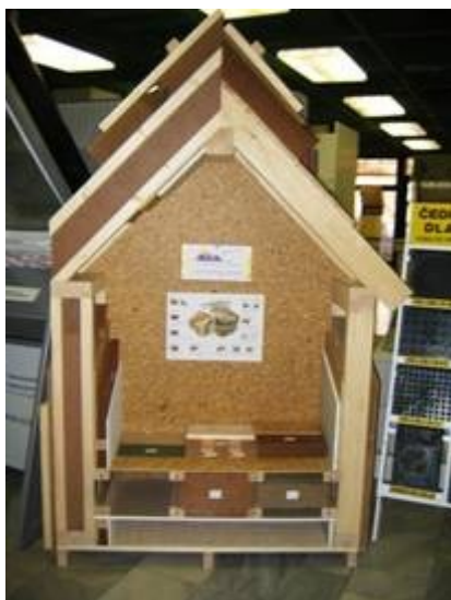
M.T.A. spol. s r.o.