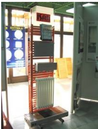
ISAN Radiátory s.r.o.